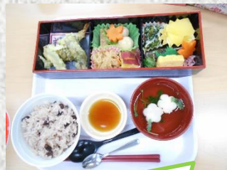
昼食は松花堂弁当です

「令和」になり当施設で二人目の百歳になられた方のお祝いを行いました。大正生まれで新時代の「令和」に100歳を迎えられ、1世紀活躍してきたことに感謝と尊敬の気持ちでいっぱいです。これからもお元気に過してください。