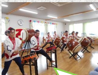
にしきの太鼓さんが和太鼓演奏を披露してくれました

皆さんにお祝いの会のお礼の言葉を頂きました。首飾りは鮎とせんべいで職員が作りました