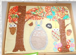
アクティブライフ今月の貼り絵