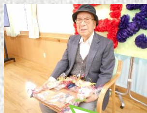
写真立てをプレゼント