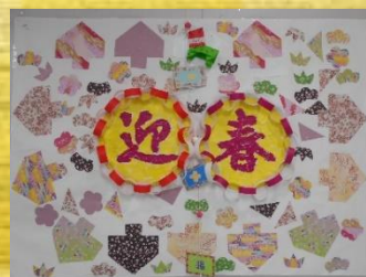
デイサービスでの壁画作品です